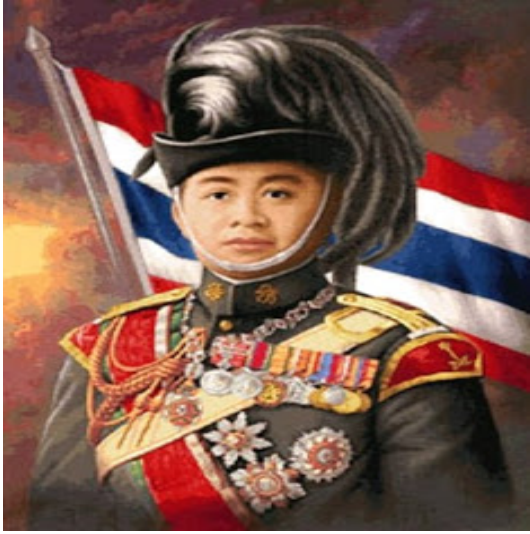
พระบาทสมเด็จพระมงกุฎเกล้าเจ้าอยู่หัว