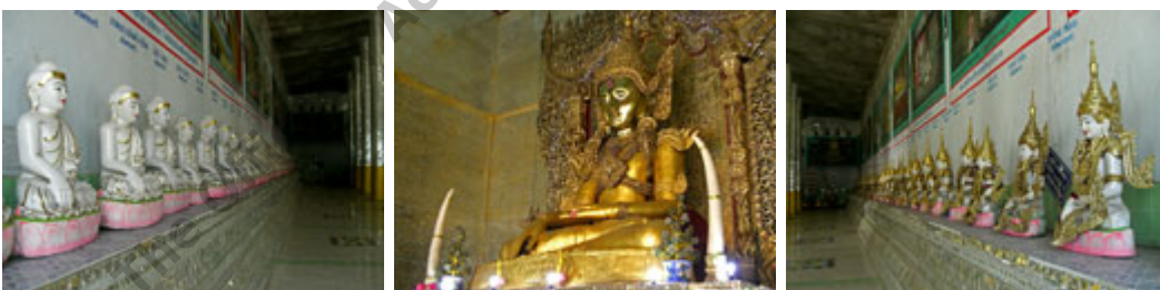
พระพุทธรูปหินอ่อนศิลปะแบบพม่า(ภาพซ้ายมือ) และพระพุทธรูปหินอ่อนทรงเครื่อง(ภาพขวามือ)ภายในพิพิธภัณฑ์พระพุทธศาสนา