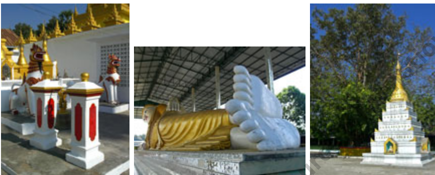
พระพุทธรูปไสยาสน์ขนาดองค์ใหญ่ และเจดีย์อื่นภายในวัด