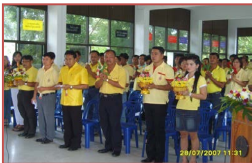
ภาพที่ ๕ นักศึกษาศูนย์บริการวิชาการ จังหวัดพิจิตร จัดพิธีไหว้ครู ณ โรงเรียนเทศบาลบ้านปากทาง เมื่อวันที่ ๒๘ กรกฎาคม พ.ศ. ๒๕๕๐

ปีการศึกษา ๒๕๕๐ โปรแกรมวิชานิติศาสตร์ ได้ริเริ่มดำเนินการเปิดศูนย์บริการวิชาการที่โรงเรียนเทศบาลบ้านปากทาง สังกัดเทศบาลเมืองพิจิตร อำเภอเมือง จังหวัดพิจิตร โดยมหาวิทยาลัย เห็นว่าเป็นการขยายโอกาสให้กับคนในจังหวัดใกล้เคียงจึงสนับสนุนให้ดำเนินการอย่างเต็มที่ ซึ่งมีการเปิดสอนทั้งสาขาวิชานิติศาสตร์ สาขาวิชารัฐประศาสนศาสตร์ของคณะมนุษยศาสตร์และสังคมศาสตร์ สาขาวิชาการจัดการทั่วไป สาขาวิชาการบริหารทรัพยากรมนุษย์ สาขาวิชาคอมพิวเตอร์ธุรกิจ สาขาวิชาการบัญชี ของคณะวิทยาการจัดการ และหลักสูตรประกาศนียบัตรวิชาชีพครูของคณะครุศาสตร์ อย่างไรก็ตาม เป็นที่น่าเสียดายอย่างยิ่ง ที่ศูนย์บริการวิชาการดังกล่าวต้องปิดตัวลง ทั้งที่การดำเนินการกำลัง เป็นไปได้ด้วยดี และยังเป็นที่ต้องการของคนในจังหวัดพิจิตร แต่เนื่องจากว่าในปี ๒๕๕๒ ได้มีประกาศกระทรวงศึกษาธิการ ว่าด้วยการจัดการศึกษานอกสถานที่ตั้งของสถาบันอุดมศึกษาของรัฐ พ.ศ. ๒๕๕๒ และประกาศคณะกรรมการการอุดมศึกษา เรื่องหลักเกณฑ์และแนวปฏิบัติเกี่ยวกับการพิจารณาประเมินคุณภาพการจัดการศึกษานอกสถานที่ตั้งของสถาบัน อุดมศึกษาของรัฐ พ.ศ. ๒๕๕๒ ซึ่งศูนย์บริการ วิชาการ จังหวัดพิจิตร อาจไม่บรรลุตามเกณฑ์ได้ครบทุกข้อตามที่คณะกรรมการการอุดมศึกษากำหนด และหากยังคงดำเนินการต่อไปอาจส่งผลกระทบต่อมหาวิทยาลัยได้ จึงทำให้ศูนย์บริการวิชาการ จังหวัด พิจิตร ได้เปิดรับนักศึกษาในปีการศึกษา ๒๕๕๓ เป็นรุ่นสุดท้าย และในภาคเรียนที่ ๒/๒๕๕๓ นี้ จะเป็น ภาคเรียนสุดท้ายของนักศึกษา ปิดตำนานศูนย์บริการวิชาการ จังหวัดพิจิตร อย่างไรก็ตาม นักศึกษาสาขาวิชานิติศาสตร์ ได้จัดตั้งชมรมศิษย์เก่านิติศาสตร์ ศูนย์พิจิตร ไว้เพื่อให้เป็นสายใยแห่งความผูกพันระหว่างนักศึกษากับมหาวิทยาลัยให้ดำรงอยู่สืบไป