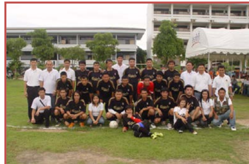
ภาพที่ ๖ การแข่งขันกีฬาเชื่อมความสัมพันธ์ระหว่าง นักศึกษากำแพงเพชรกับนักศึกษาพิจิตร ณ โรงเรียนเทศบาลบ้านปากทาง เมื่อวันที่ ๒๐ มิถุนายน พ.ศ. ๒๕๕๒

นอกจากนี้ ในปี พ.ศ. ๒๕๕๐ มหาวิทยาลัยได้อนุมัติงบประมาณให้โปรแกรมวิชานิติศาสตร์ จัดสร้างห้องปฏิบัติการศาลจำลอง เพื่อรองรับการตรวจประเมินคุณภาพจากสำนักฝึกอบรมวิชาว่า ความแห่งสหภาพอาเซียน และเป็นไปตามมาตรฐานของสำนักอบรมศึกษากฎหมายแห่งเนติบัณฑิตยสภา ซึ่งผลในระยะยาวนั้นถือว่าการก่อให้เกิดประโยชน์อย่างสูงกับนักศึกษาและอาจารย์ได้ใช้ประกอบการ เรียนการสอน