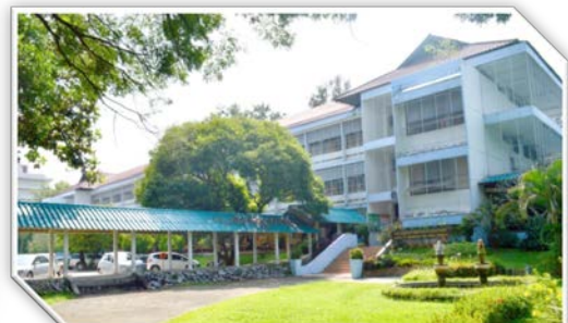
ภาพที่ ๒ อาคารคณะมนุษยศาสตร์และสังคมศาสตร์ (ถ่ายมุมด้านซ้ายของอาคาร)