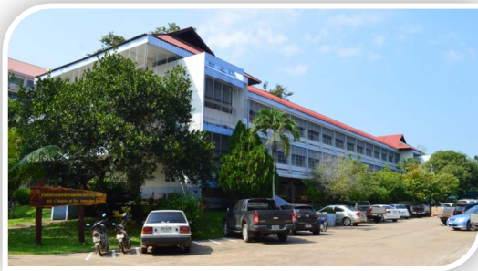
ภาพที่ ๑ อาคารคณะมนุษยศาสตร์และสังคมศาสตร์ (ถ่ายมุมด้านขวาของอาคาร)

ในปี ๒๕๑๖ - ๒๕๑๗ กรมการฝึกหัดครูได้จัดสรรเงินงบประมาณสำหรับการก่อสร้างวิทยาลัยครูกำแพงเพชร ตามโครงการเงินยืมจากธนาคารโลก จำนวนเงิน ๒๑,๘๙๐,๐๐๐ บาท