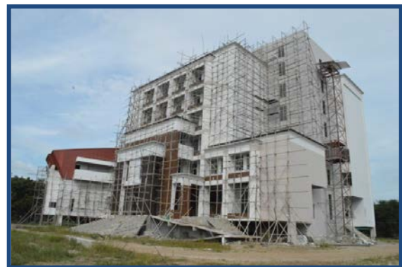
ภาพที่ ๖ อาคารคณะมนุษยศาสตร์และสังคมศาสตร์หลังใหม่ที่กำลังก่อสร้าง (คาดว่าจะแล้วเสร็จต้นปี พ.ศ. ๒๕๕๗)

พัฒนาการของคณะมนุษยศาสตร์และสังคมศาสตร์นับตั้งแต่อดีตจนถึงปัจจุบัน โดยเฉพาะตั้งแต่มีการประกาศใช้พระราชบัญญัติการศึกษาแห่งชาติ พ.ศ. ๒๕๔๒ เป็นต้นมานั้น คณะมนุษยศาสตร์และสังคมศาสตร์ ได้ดำเนินการปฏิรูปและพัฒนาการศึกษา ดังต่อไปนี้