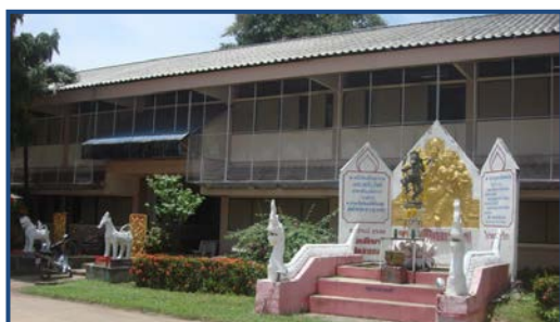
ภาพที่ ๓ อาคารศิลปะ

พ.ศ. ๒๕๒๖ สภาการฝึกหัดครูได้ประกาศใช้หลักสูตรการฝึกหัดครู พ.ศ. ๒๕๒๖ ซึ่งเป็นหลักสูตรที่ใช้ผลิตครูระดับประกาศนียบัตรวิชาการศึกษาชั้นสูง (ป.กศ. ชั้นสูง) ๒ ปี และระดับปริญญาตรี ๒ ปี (ค.บ.) วิชาเฉพาะของคณะศึกษามนุษยศาสตร์และสังคมศาสตร์ ประกอบด้วย ๑) ดนตรีศึกษา ๒) นาฏศิลป์ ๓) บรรณารักษศาสตร์ ๔) ภาษาไทย ๕) ภาษาอังกฤษ ๖) สังคมศึกษา ๗) สังคมวิทยา ๘) รัฐศาสตร์ ๙) เศรษฐศาสตร์ ๑๐) ปรัชญาและศาสนา ๑๑) ภูมิศาสตร์ ๑๒) ประวัติศาสตร์ ๑๓) ศิลปศึกษา