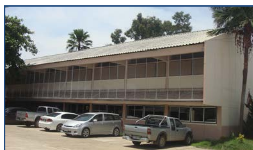
ภาพที่ ๔ อาคารดนตรี