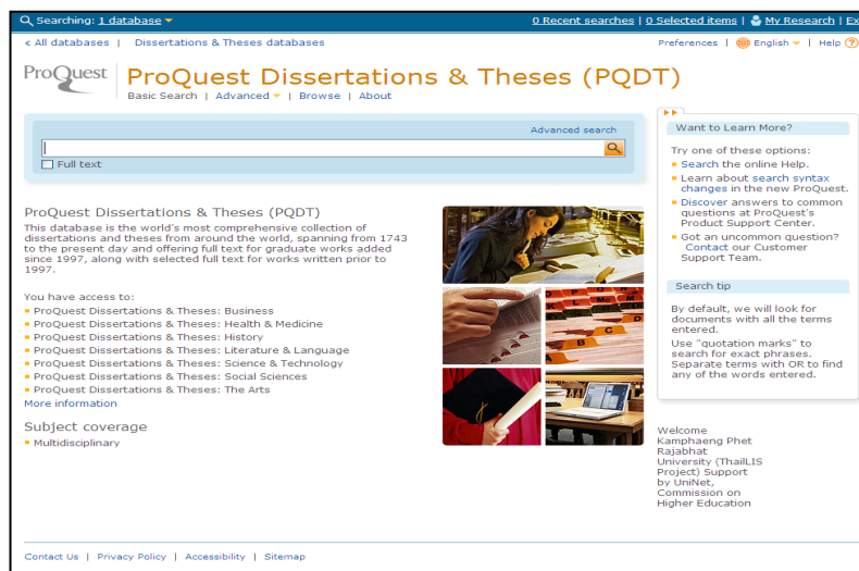
ภาพที่ 7.18 ตัวอย่างฐานข้อมูลเชิงพาณิชย์ของ ProQuest PQDT (ThaiLIS)

12. ProQuest PQDT (ThaiLIS) เป็นฐานข้อมูลออนไลน์ที่รวบรวมบทความวิทยานิพนธ์ระดับปริญญาโทและปริญญาเอกของมหาวิทยาลัยทั่วโลก ให้รายการบรรณานุกรมตั้งแต่ปี ค.ศ. 1861 และให้สาระสังเขปตั้งแต่ปี ค.ศ. 1981 วิทยานิพนธ์ตั้งแต่ 1997 ขึ้นไป สามารถดาวน์โหลด 24 หน้าแรกได้ ปัจจุบันมีข้อมูลมากกว่า 2 ล้านรายการ