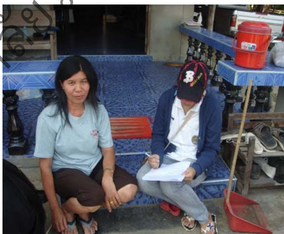
ประชาชน หมู่บ้านแม่กุเหนือ ให้ความสนใจและให้ความร่วมมือเป็นอย่างดีแก่คณะผู้วิจัย ในการลงพื้นที่สัมภาษณ์ ทำวิจัย