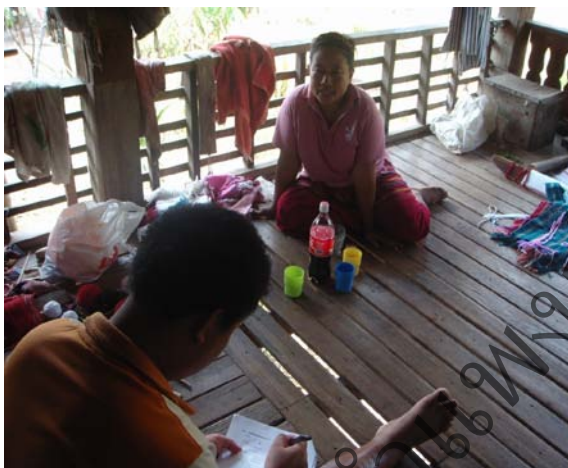
คณะผู้วิจัยได้สัมภาษณ์ประชาชนบ้านปุเตอร์ และได้รับความร่วมมือจากการตอบแบบสัมภาษณ์เป็นอย่างดี