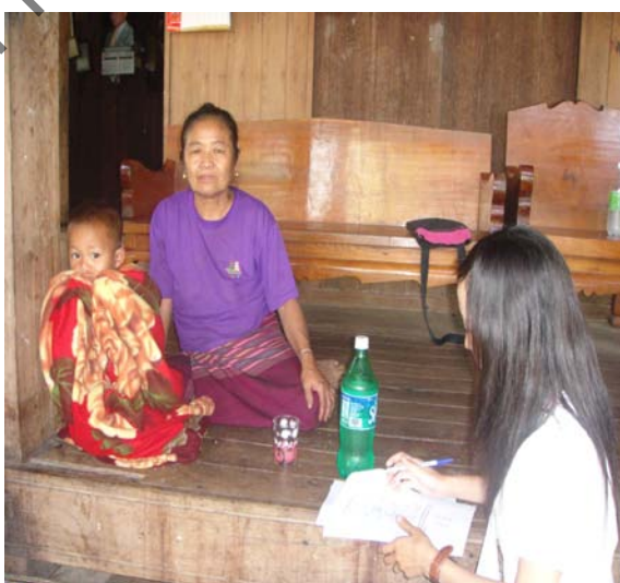
ประชาชนบ้านหนองน้ำเขียวให้ความร่วมมือในการตอบแบบสัมภาษณ์