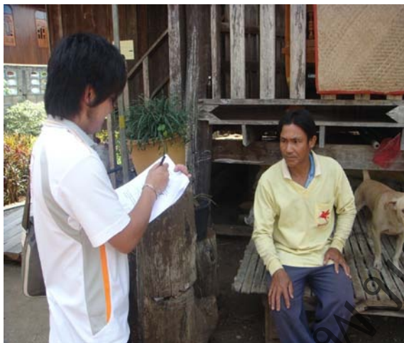
คณะผู้วิจัยลงพื้นที่สัมภาษณ์ประชาชนบ้านผาลาด จากการสัมภาษณ์ประชาชนในพื้นที่ให้ ความร่วมมือเป็นอย่างดี