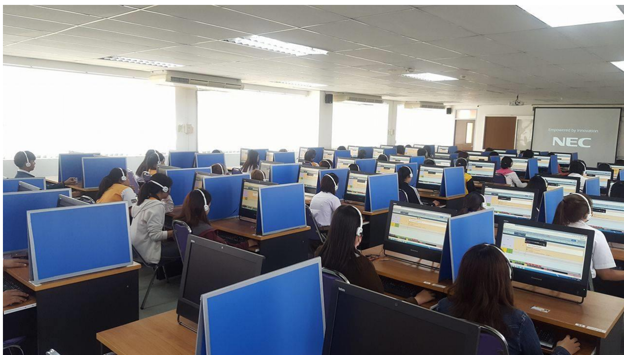
ภาพที่ 4 แสดงผู้สอบกำลังสอบมาตรฐานความรู้ด้านภาษาอังกฤษออนไลน์