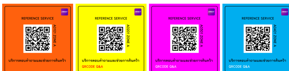
ภาพที่ 1-1 QRCode

ผู้ใช้บริการสามารถเข้าถึงบริการด้วยการ Scan QRCode บริเวณพื้นที่บริการ