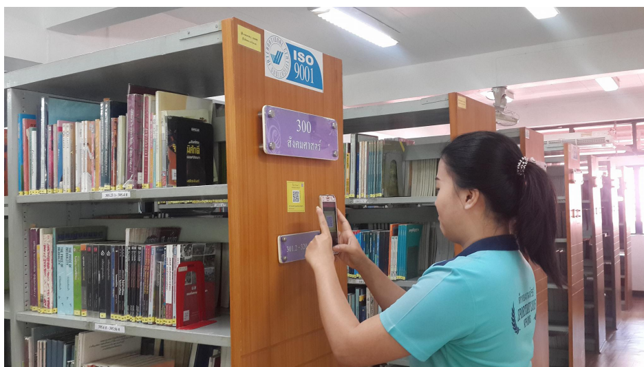
ภาพที่ 1-2 พื้นที่ให้บริการ