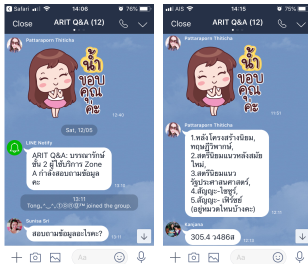
ภาพที่ 2-1 บริการตอบคำถาม