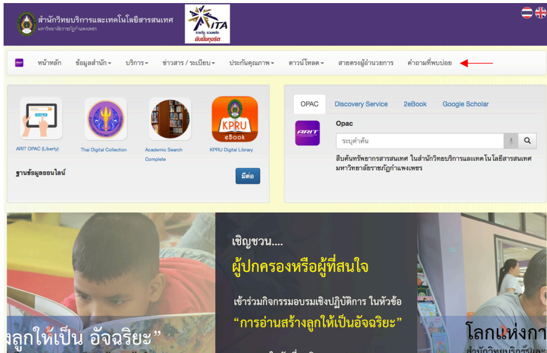
ภาพที่ 4-1 เว็บไซต์ สำนักวิทยบริการและเทคโนโลยีสารสนเทศ

คำถามที่ลูกบ้านทักเพื่อให้บริการตอบคำถามและช่วยการค้นคว้า