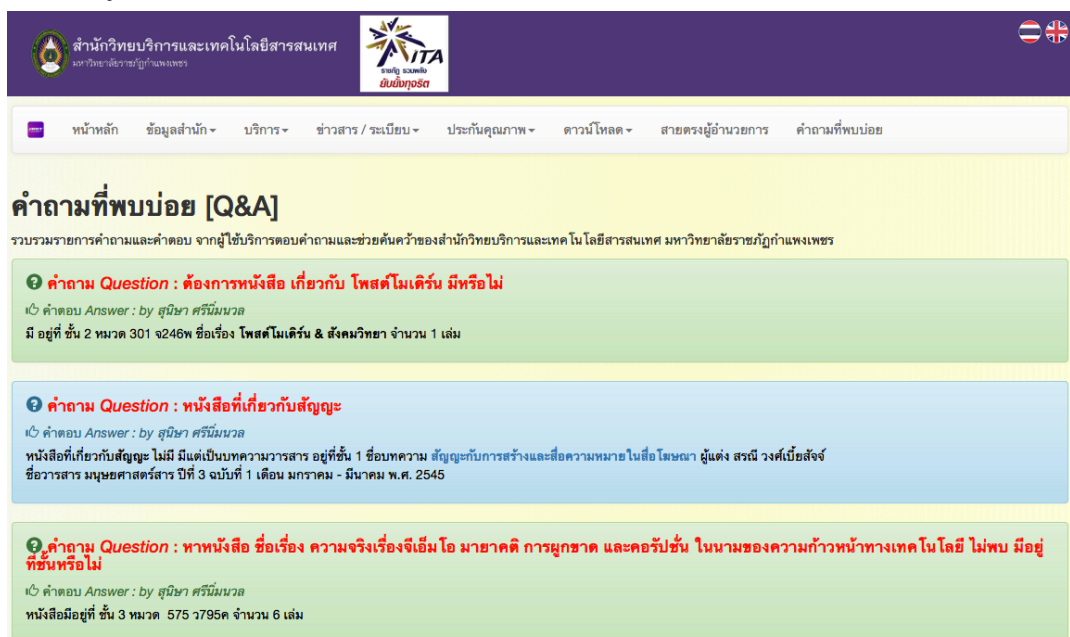
ภาพที่ 4-2 คำถามที่พบบ่อย

คำถามที่ลูกบ้านทักเพื่อให้บริการตอบคำถามและช่วยการค้นคว้า