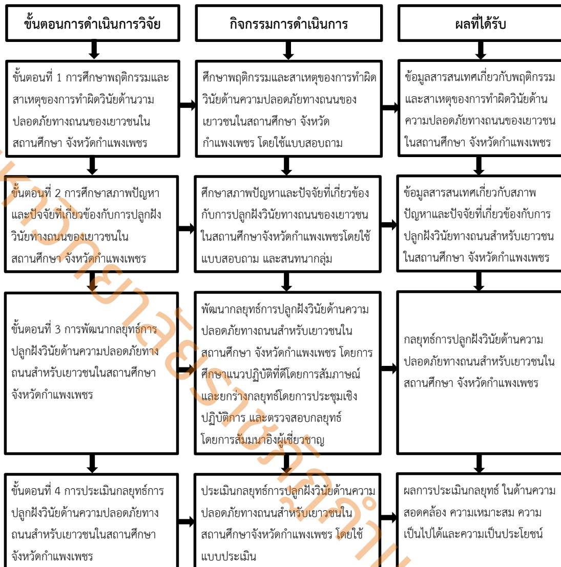
ภาพที่ 2 แสดงกระบวนการดำเนินการวิจัยการพัฒนากลยุทธ์การปลูกฝังวินัยด้านความปลอดภัยทางถนนสำหรับเยาวชนในสถานศึกษา จังหวัดกำแพงเพชร