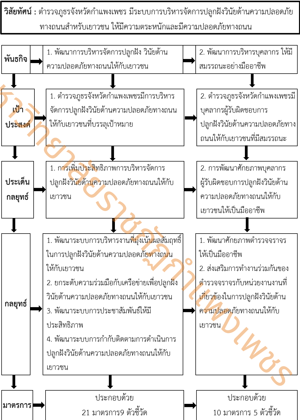
ภาพที่ 4 แสดงความเชื่อมโยงของวิสัยทัศน์ พันธกิจ เป้าประสงค์ ประเด็นกลยุทธ์ ตัวชี้วัดและ มาตรการ (ร่าง)