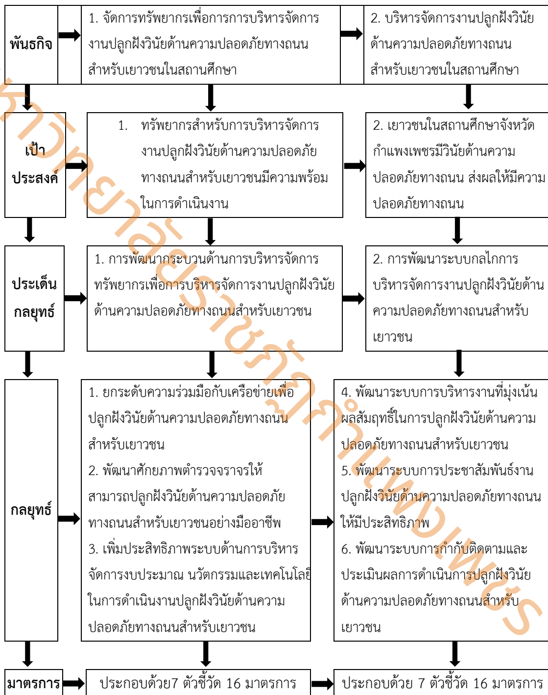
ภาพที่ 5 แสดงความเชื่อมโยงของวิสัยทัศน์ พันธกิจ เป้าประสงค์ ประเด็นกลยุทธ์ ตัวชี้วัดและมาตรการ

วิสัยทัศน์ : ดำรงมาตรฐานจังหวัดกำแพงเพชร บริหารจัดการงานปลูกฝังวินัยด้านความปลอดภัยทางถนนสำหรับเยาวชนอย่างเป็นระบบและมีประสิทธิภาพเพื่อให้เยาวชนมีความปลอดภัยทางถนน