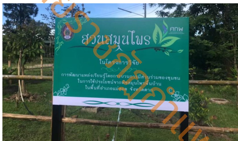
ภาพที่ 1 สวนสมุนไพร

1). การจัดทำสวนสมุนไพร จัดแสดงในพื้นที่จำนวน 80 ตารางเมตร ในศูนย์การเรียนรู้ตามแนวปรัชญาเศรษฐกิจพอเพียงและเกษตรทฤษฎีใหม่ มหาวิทยาลัยราชภัฏกำแพงเพชร แม่สอด โดยปลูกสมุนไพรจำนวน 12 ชนิด ตามผลการวิเคราะห์ข้อมูล ได้จัดทำป้ายบอกชื่อของสมุนไพร ชื่อพื้นบ้าน รูปภาพของสมุนไพร และคิวอาร์โค้ดสำหรับการเข้าถึงข้อมูลของแหล่งเรียนรู้แบบออนไลน์ ดังนี้