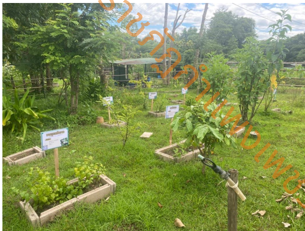
ภาพที่ 3 การปลูกสมุนไพรพื้นบ้านในสวนสมุนไพร