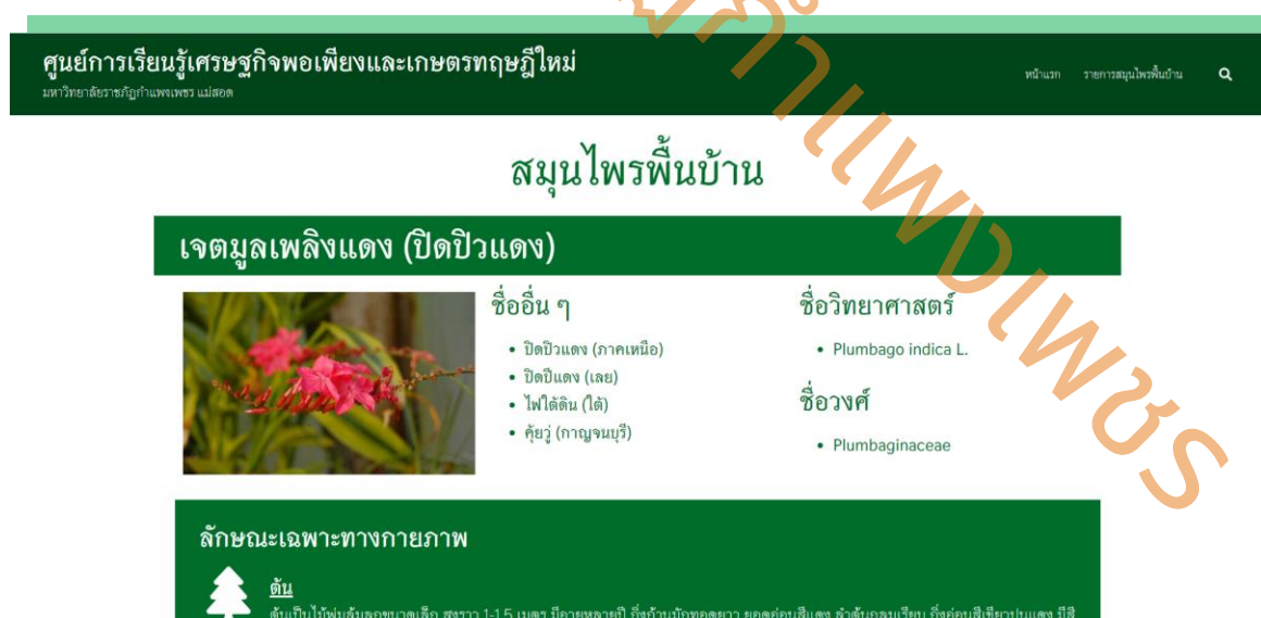
ภาพที่ 5 การนำเสนอข้อมูลสมุนไพรในเว็บไซต์ของศูนย์การเรียนรู้ตามแนวปรัชญาเศรษฐกิจพอเพียงและเกษตรทฤษฎีใหม่ มหาวิทยาลัยราชภัฏกำแพงเพชร แม่สอด