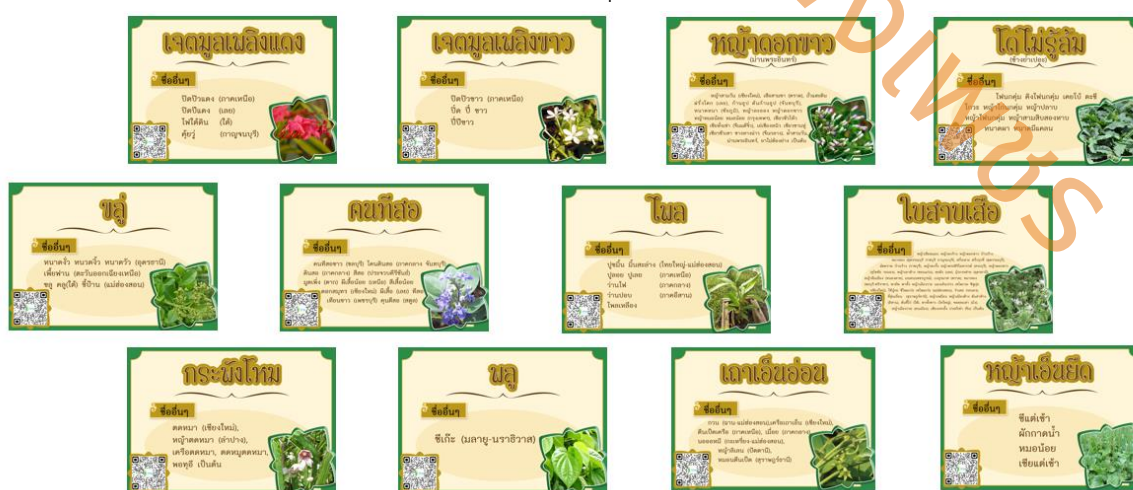
ภาพที่ 2 ป้ายชื่อสมุนไพรและคิวอาร์โค้ดสำหรับการเข้าถึงข้อมูลแบบออนไลน์