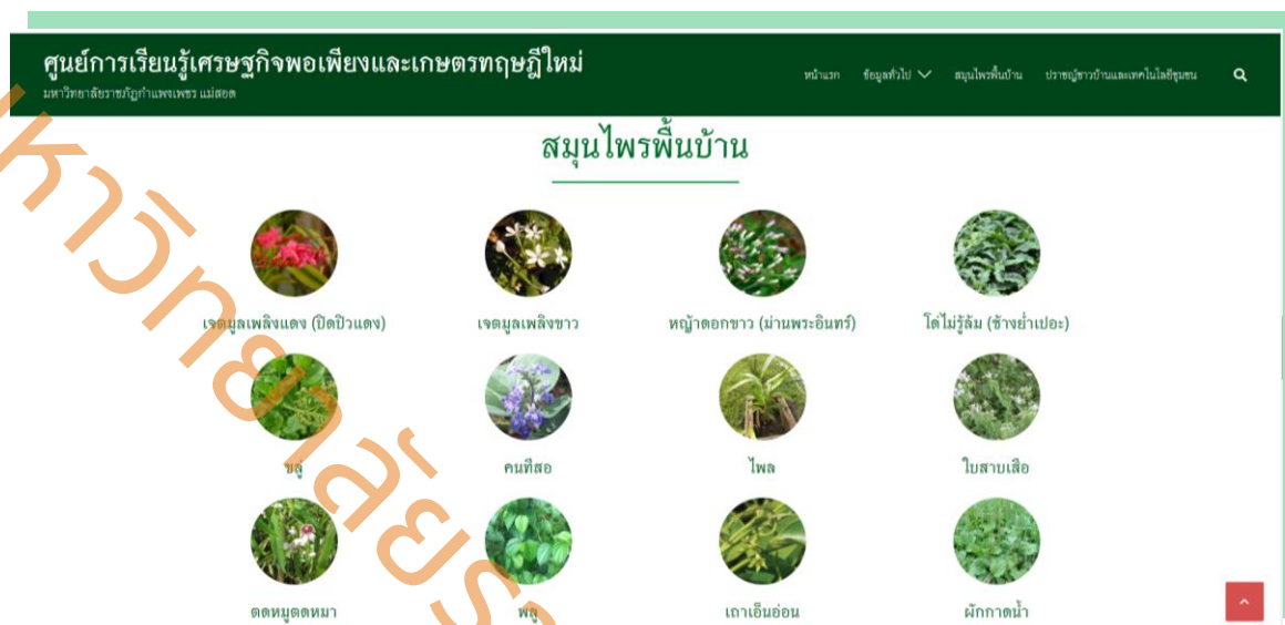
ภาพที่ 4 หน้าเว็บไซต์สมุนไพรพื้นบ้าน ในเว็บไซต์ของศูนย์การเรียนรู้ตามแนวปรัชญาเศรษฐกิจพอเพียงและเกษตรทฤษฎีใหม่ มหาวิทยาลัยราชภัฏกำแพงเพชร แม่สอด

2) การจัดทำสื่อการเรียนรู้แบบออนไลน์ โดยได้นำเสนอในเว็บไซต์ของศูนย์การเรียนรู้ตามแนวปรัชญาเศรษฐกิจพอเพียงและเกษตรทฤษฎีใหม่ มหาวิทยาลัยราชภัฏกำแพงเพชร แม่สอด หัวข้อ สมุนไพรพื้นบ้าน ที่ URL: https://maesot.kpru.ac.th/suffeco/ โดยนำเสนอข้อมูลดังนี้