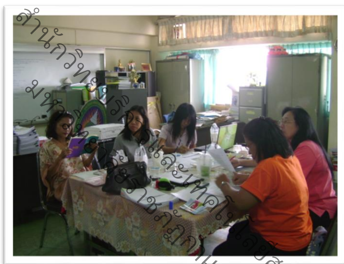
การประชุมเตรียมความพร้อม