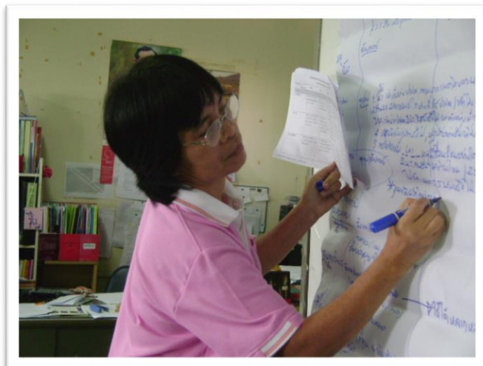
นักวิจัยลงพื้นที่โรงเรียนกาญจนาภิเษกวิทยาลัยเพชรบูรณ์ อ.หล่มสัก จ.เพชรบูรณ์