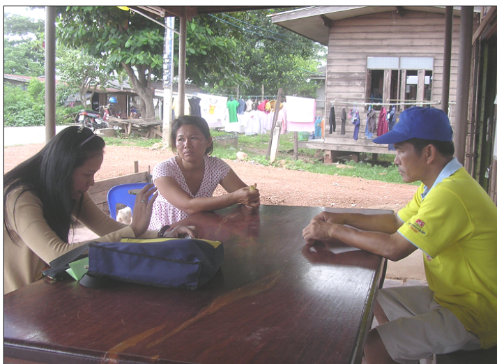
เก็บข้อมูลโดยใช้ แบบสัมภาษณ์