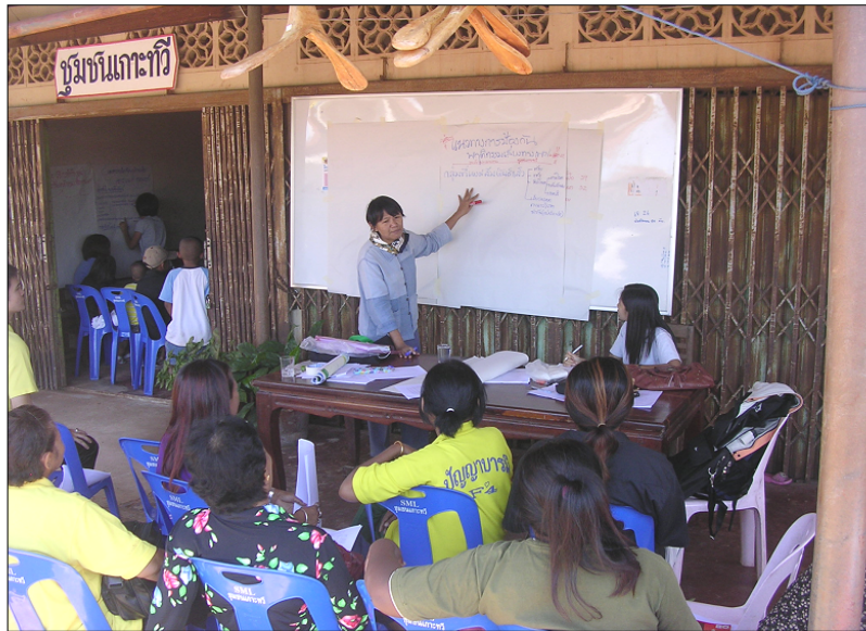
การสนทนาแนวทางการป้องกันพฤติกรรมเสี่ยงทางเพศของผู้แทนชุมชน