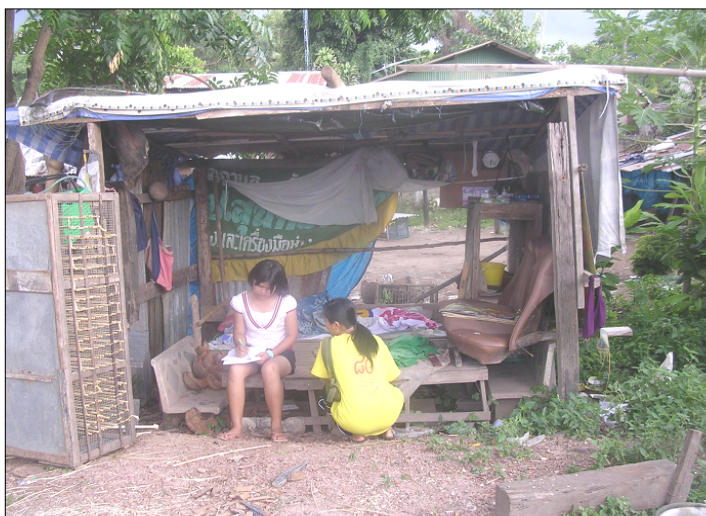
เก็บข้อมูลโดยใช้ แบบสอบถาม

ณ ชุมชนเกาะทิว อำเภอมืองกำแพงเพชร จังหวัดกำแพงเพชร