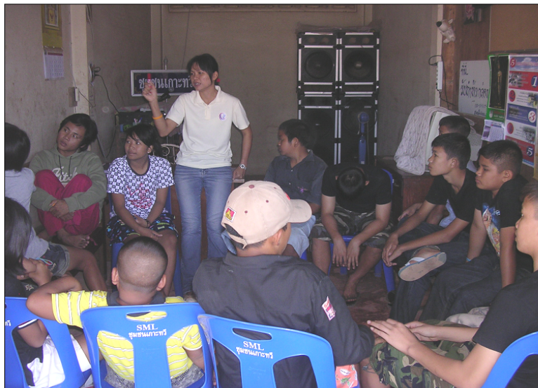
การสนทนาแนวทางการป้องกันพฤติกรรมเสี่ยงทางเพศของกลุ่มเด็กและเยาวชน