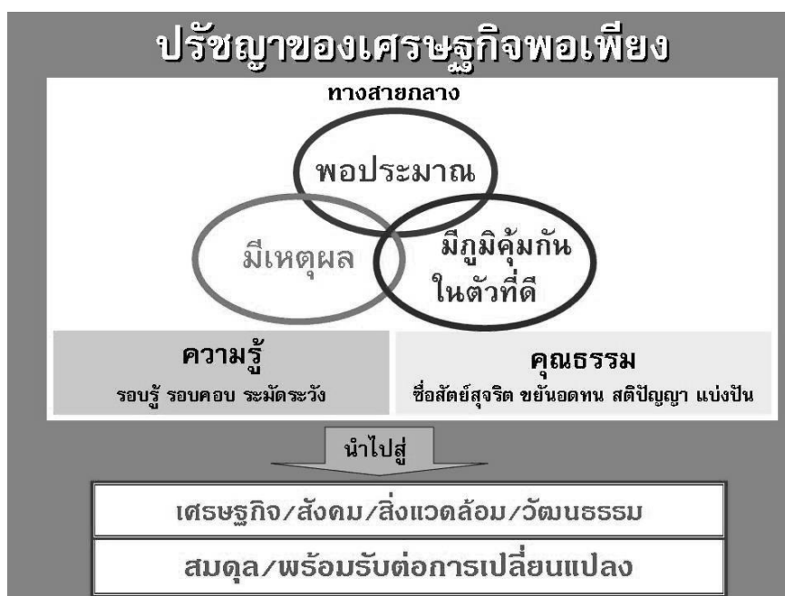
ภาพ 2.1 ปรัชญาของเศรษฐกิจพอเพียง

จากความหมายของเศรษฐกิจพอเพียง สรุปได้ว่า เศรษฐกิจพอเพียงหมายถึง การใช้ชีวิตอย่างมีเหตุผล พอประมาณ พออยู่พอกิน ใช้จ่ายอย่างมีเหตุผล ไม่เบียดเบียนตนเองและผู้อื่น โดยอาศัยทั้งความรู้และคุณธรรม เน้นการพึ่งตนเอง และมีเป้าหมายคือการมีชีวิตที่มีความสุขโดยอยู่บนพื้นฐานของพึ่งตนเองและพัฒนาตนเอง ครอบครัว ชุมชนและระดับประเทศเป็นลำดับ