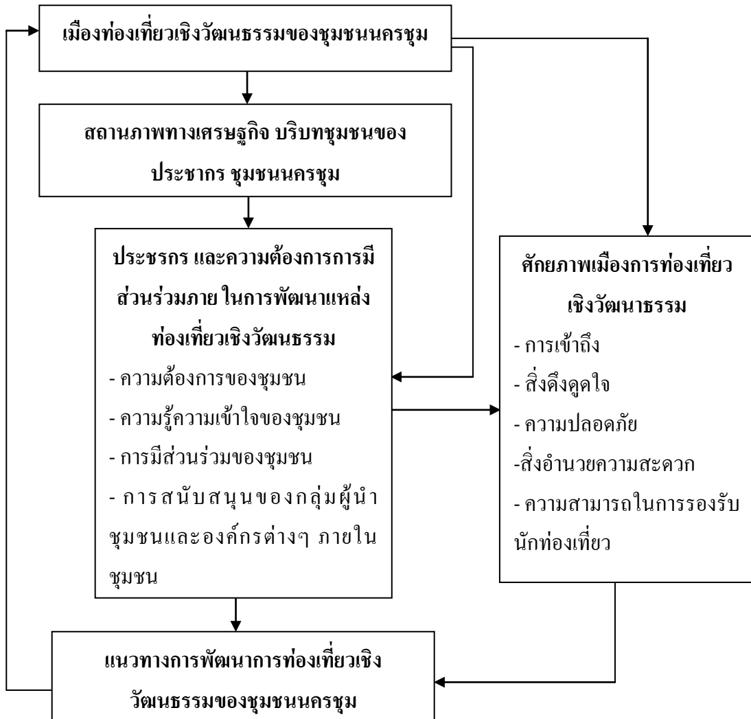
ภาพที่ 1 กรอบแนวคิดการวิจัย