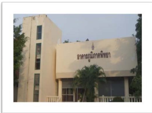
อาคารภูมิภาคศึกษา