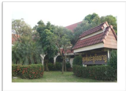
หอศิลปะดุริยางค์